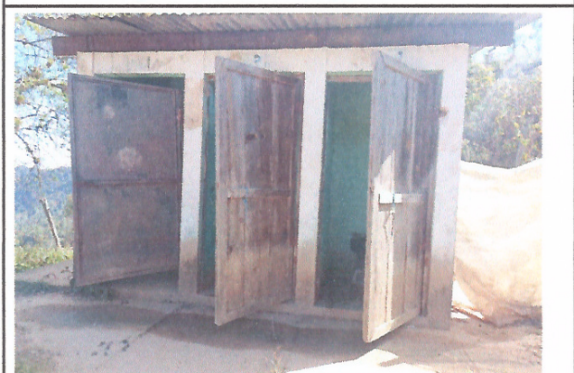
Foto 4: ESTA IMAGEN NOS MUESTRA EL MAL ESTADO DE LAS PUERTAS Y EL TECHO DE LOS SERVICIOS SANITARIOS

Observación: Si es necesario se pueden agregar hojas adicionales y actualizar el número de hojas.