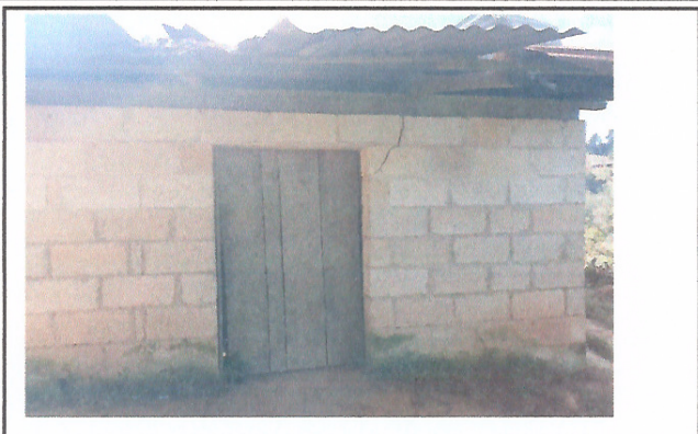
Foto 2: ESTA IMAGEN MUESTRA LA AGRETADURA DE LAS PAREDES Y EL DETERIORO DE LA PUERTA