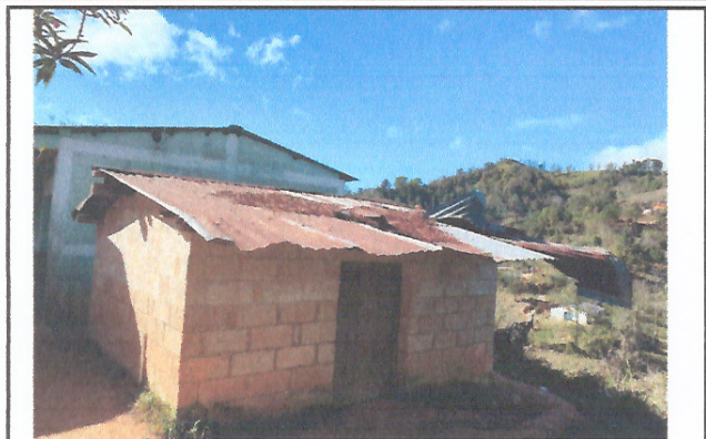
Foto 1: ESTA IMAGEN NOS MUESTRA EL DETERIORO DEL TECHO, DEL LUGAR QUE SE UTILIZA COMO COSINA